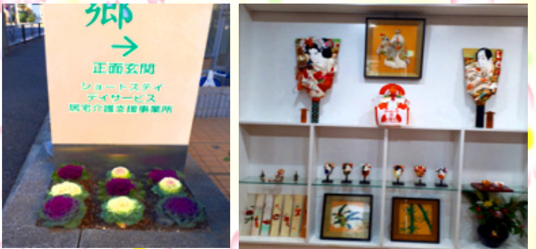
1階エントランスと中坂通りに正月の飾りつけを行いました。