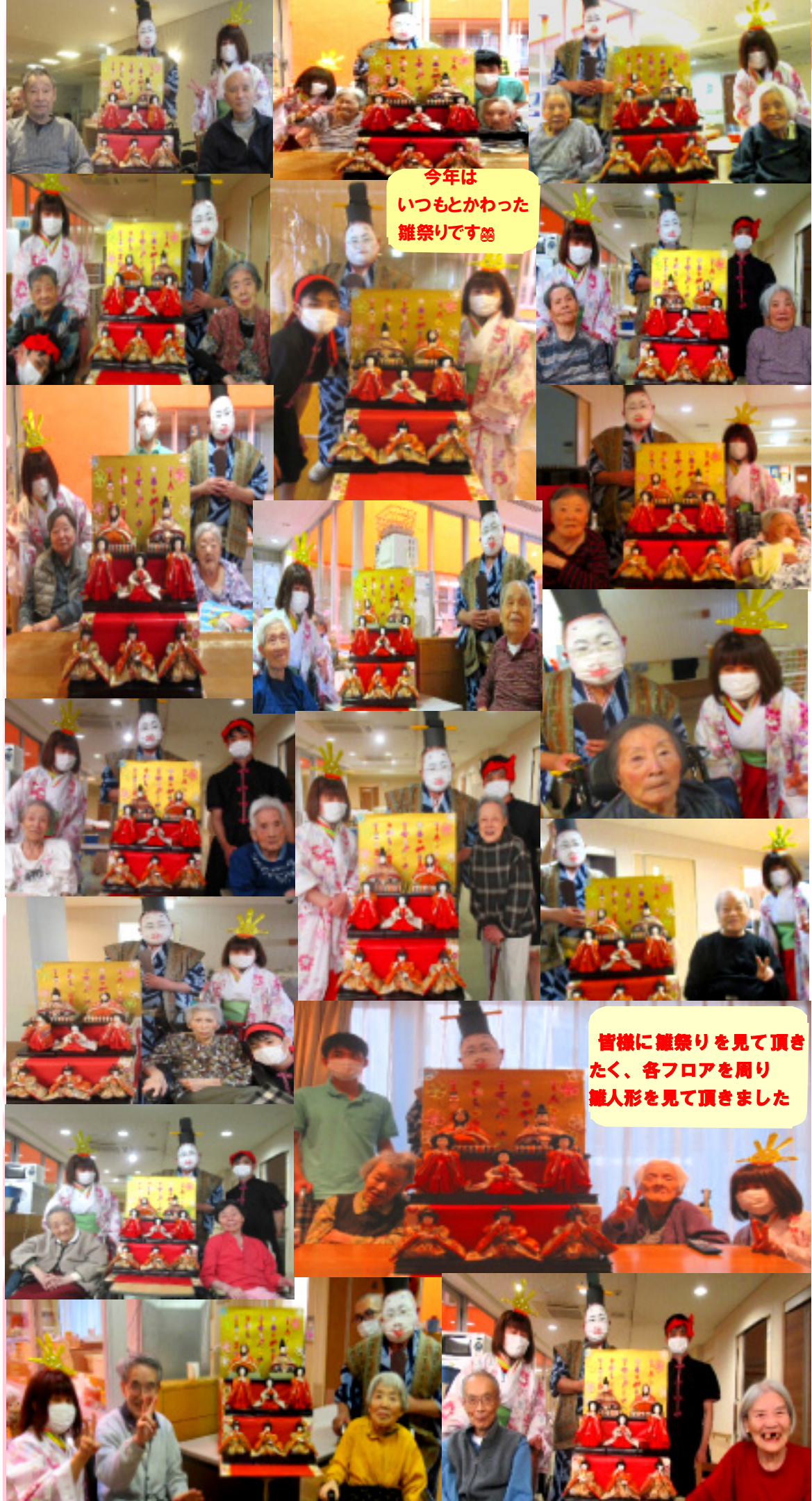
今年は いつもとかわった 雑祭りです