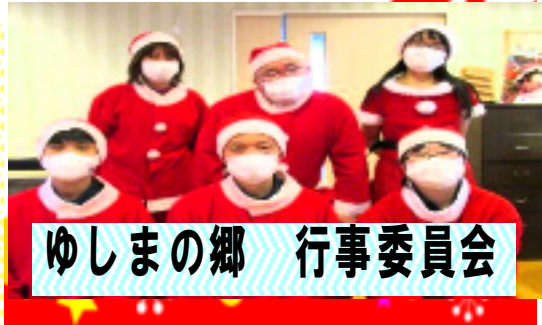
ゆしまの郷 行事委員会