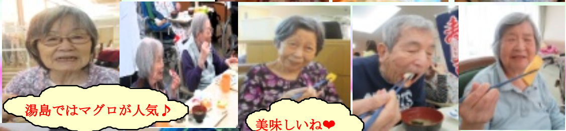
湯島ではマグロが人気♪