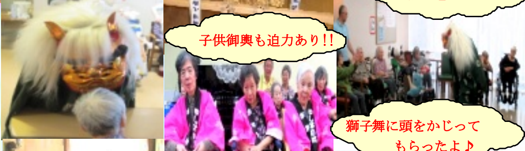
子供御輿も迫力あり!!