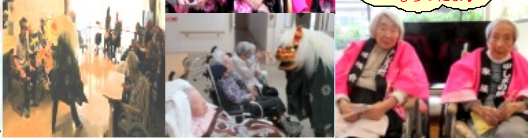
獅子舞に頭をかじってもらったよ♪