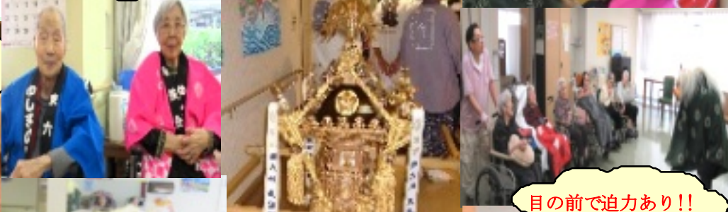
目の前で迫力あり!!