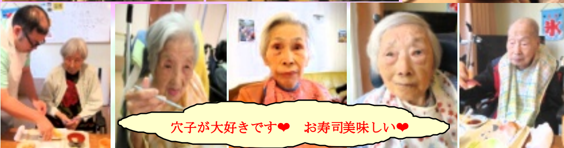
穴子が大好きです♥ お寿司美味しい♥