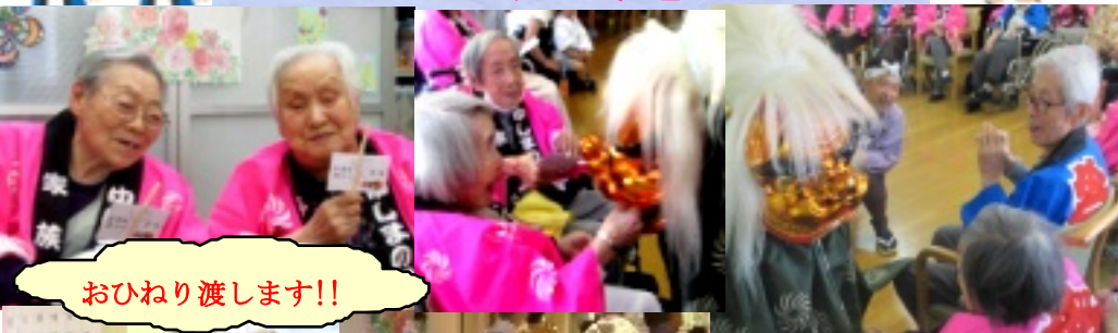
おひねり渡します!!