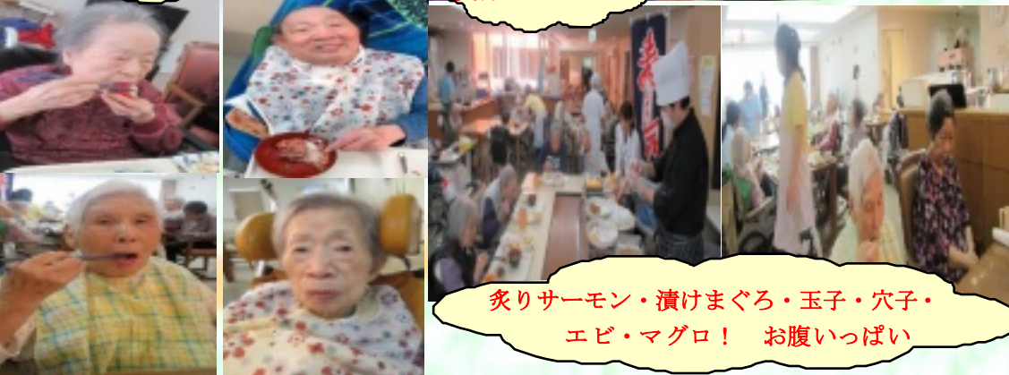
炙りサーモン・漬けまぐろ・玉子・穴子・エビ・マグロ! お腹いっぱい