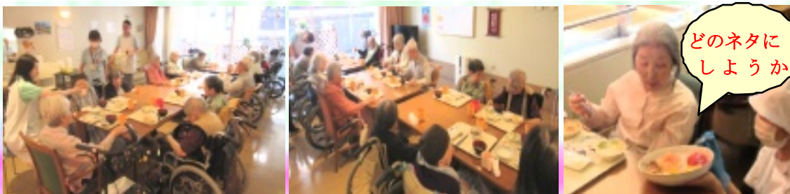
どのネタにしようか