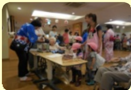
ミルキーホームの園児達が遊びに来てくれました