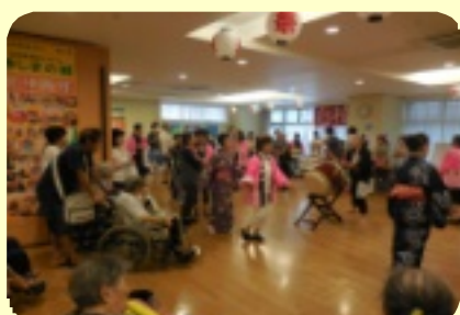
祭りといえば、盆踊りですね