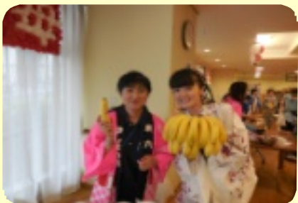
デイ、白十字、東京リネンさん達がお手伝いに来てくれました