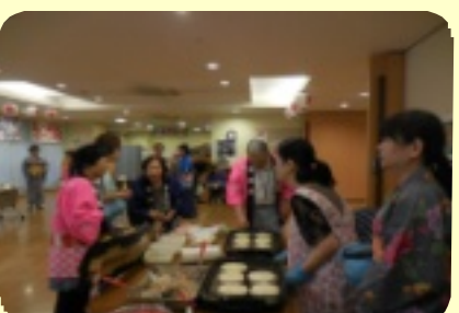
納涼祭参加ありがとうございました。来年もお楽しみに！