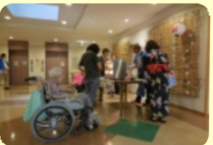
居宅、厨房さんコンビでホット、唐揚げ販売してます