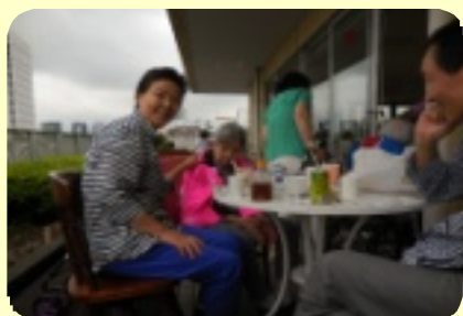
8階のテラスでお食事です