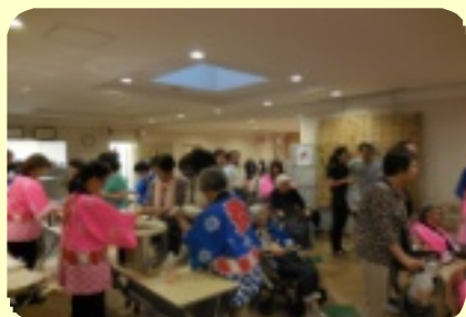
家族会の方々がお好み焼き、焼きそば、チャーハン、ゲーム等のお手伝いをしてくれました。