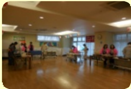
納涼祭が始まります

にアクセスして頂きご覧いただけます。また、1階 受付横のラックにインターネットと同じ内容を施設内で検討して、サービス向上に努めて参ります。お忙しい中、ご家族アンケートにご協力頂きありがとうございました。