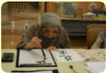
毎月、第一土曜日は書道クラブの日です。みなさん真剣な表情で書かれていました。